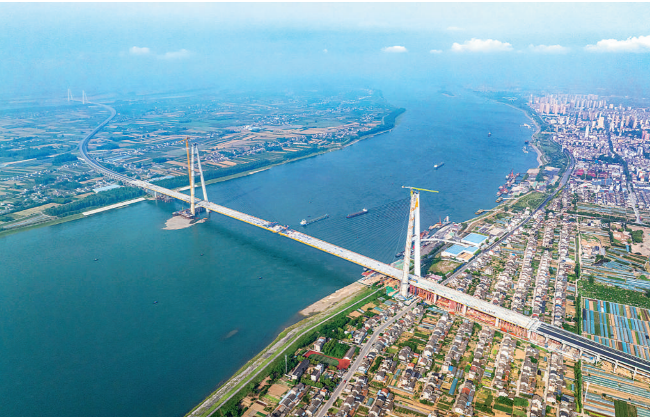
5月15日，枝江长江大桥顺利合龙，为项目建成通车奠定了重要基础。图为施工现场。

发布仪式现场播放了“最美家庭”先进事迹的视频短片，多角度讲述了他们的家庭故事。中央宣传部、全国妇联负责同志为他们颁发“最美家庭”证书。