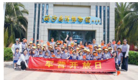
军属在西沙永兴岛合影。

在祖国南端,南海深处,有片被阳光与海浪拥抱的土地——西沙群岛。这里,不仅有碧蓝的海天、炙热的骄阳,更有一群以岛为家的守岛官兵。他们像一棵棵抗风桐,把根深深扎进礁石与沙土,任凭风浪洗礼,依然挺立成一片倔强的绿色。