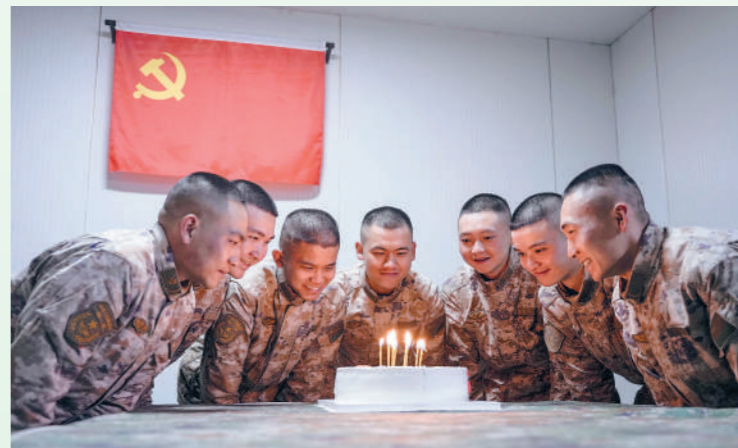
生日会上,官兵一起吹蜡烛。

昆仑山脉深处,寒风如刀,雪原茫茫。这里是祖国版图最西端的康西瓦,新疆军区某部的高原驻训地,仅有一条蜿蜒陡峭的天路连接着外面的世界。