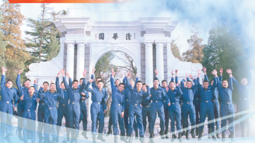
空军“清华班”飞行员合影。