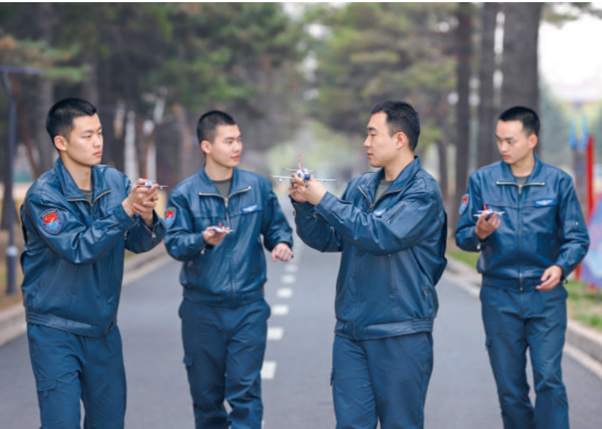
飞行学员进行地面演练。