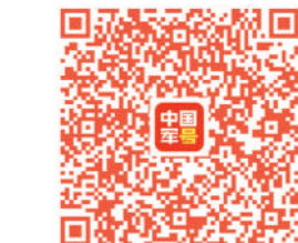
扫描二维码“对话”飞行员