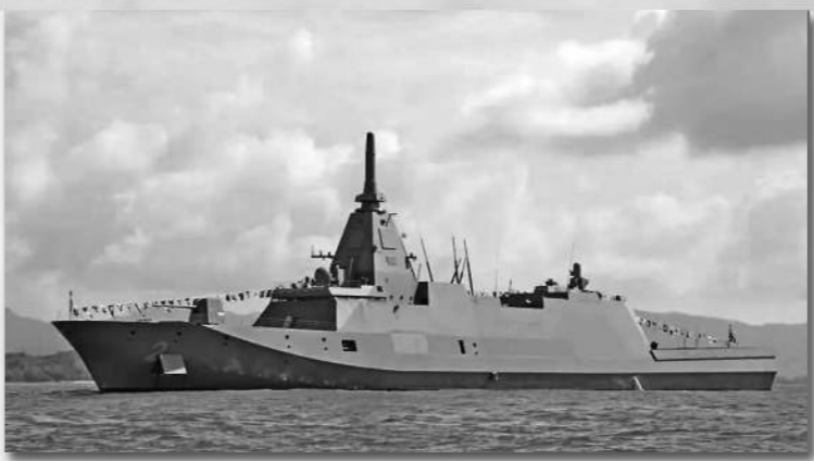
日本“最上”级护卫舰。

新闻事实：日本与澳大利亚近期正式签署协议，将基于日本升级版“最上”级护卫舰“共同开发”澳海军新型舰艇，这标志着日澳防务合作进入新阶段。