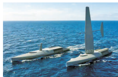
“幽灵”大型无人水面舰艇。

据外媒报道,美国一家无人系统公司近日发布“幽灵”大型无人水面舰艇。其长52米,最高航速30节,旨在为美海军提供持续的反潜、侦察及打击能力。