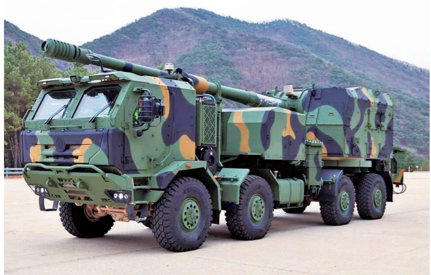
K9MH型155毫米轮式自行火炮。

K9MH型155毫米轮式自行火炮采用多国通用的捷克太脱拉越野底盘,炮塔基于K9A2的成熟设计改造,从而大幅压低了研发成本与生产难度。未来,借助K9系列自行火炮成熟的用户网络和后勤保障体系,K9MH型155毫米轮式自行火炮在国际市场上具备一定竞争力。