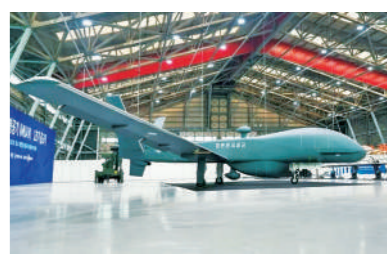
韩国“中高空侦察无人机”。

据外媒报道,韩国近日首次公开展示“中高空侦察无人机”,又称“韩国版死神”。这是韩国首款战略级无人机,备受外界关注。