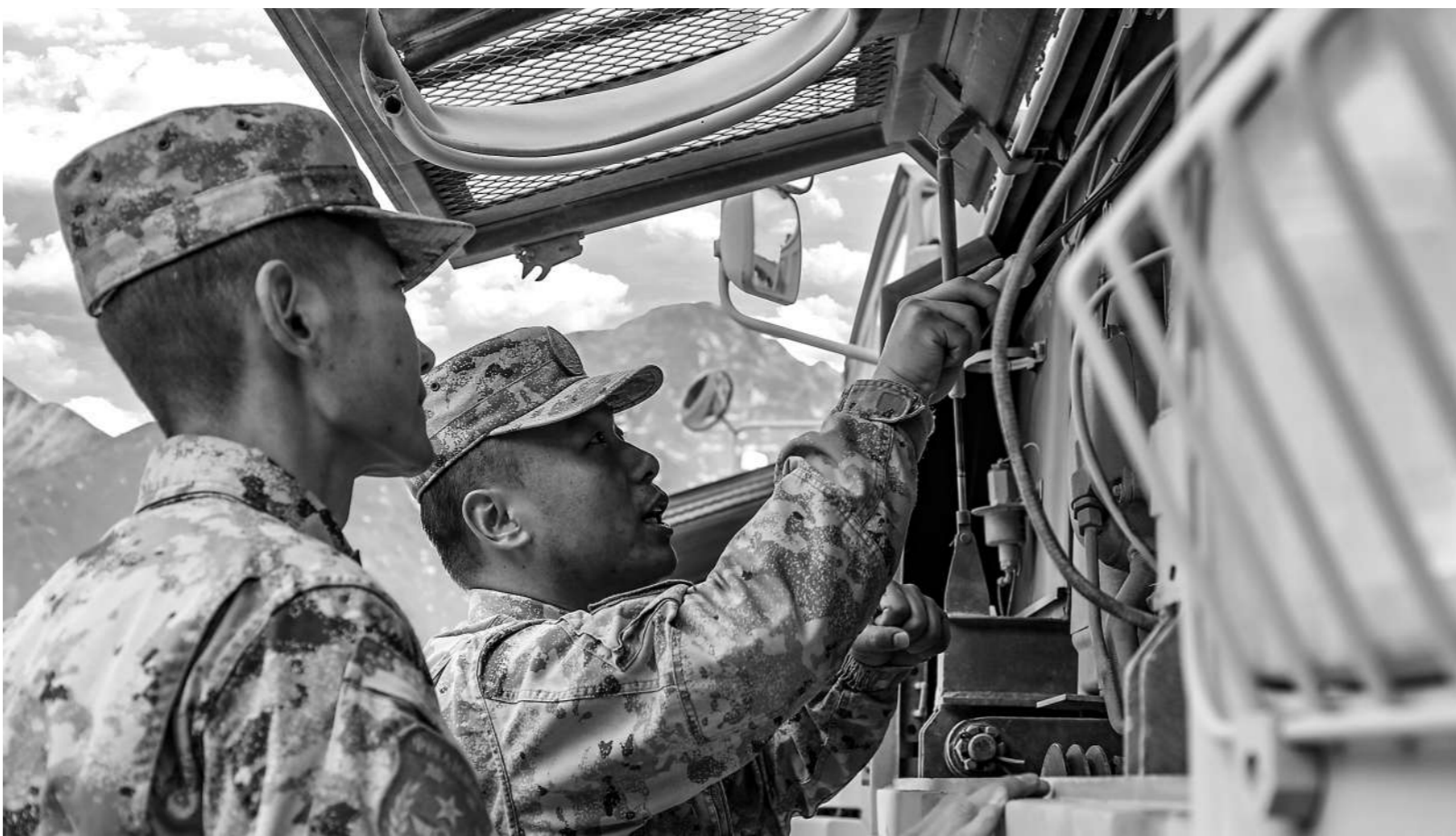
四月上旬,新疆军区某部结束驾驶员训练后,官兵对车辆进行回场后保养。

如今,我们的监督覆盖了从计划受领到合同签订的全过程,既是震慑,更是守护。小组成员定期开展采购法规集中学习,不断拓展知识面,丰富监督的方式方法,实实在在提升了发现问题、解决问题的能力。