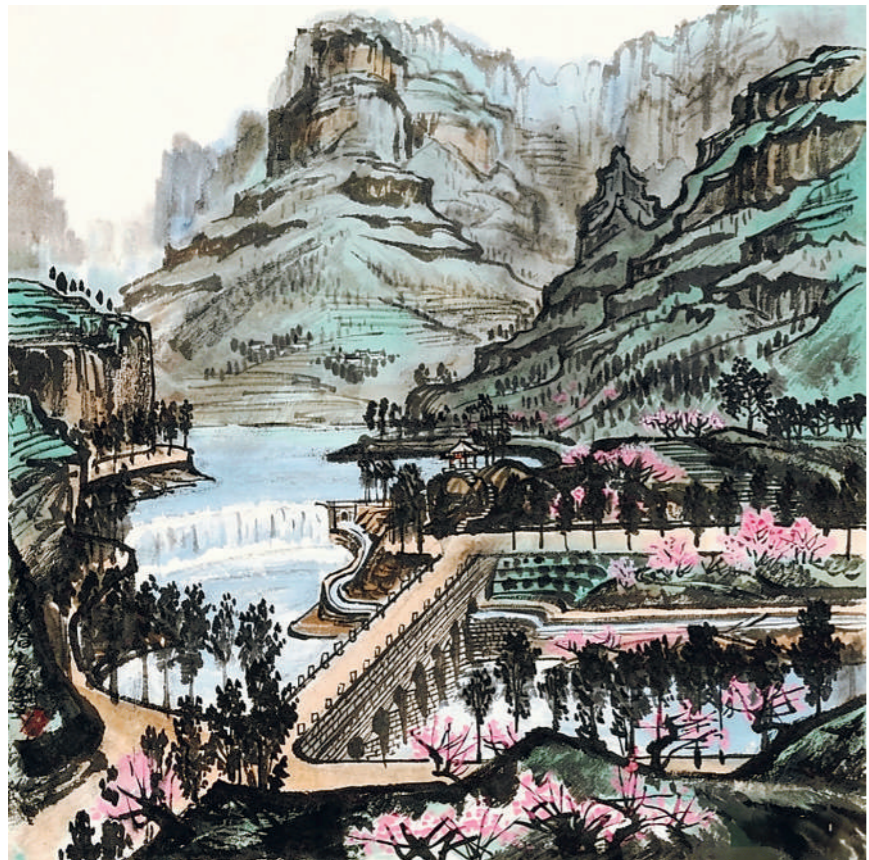
太行春(中国画,中国美术馆藏)