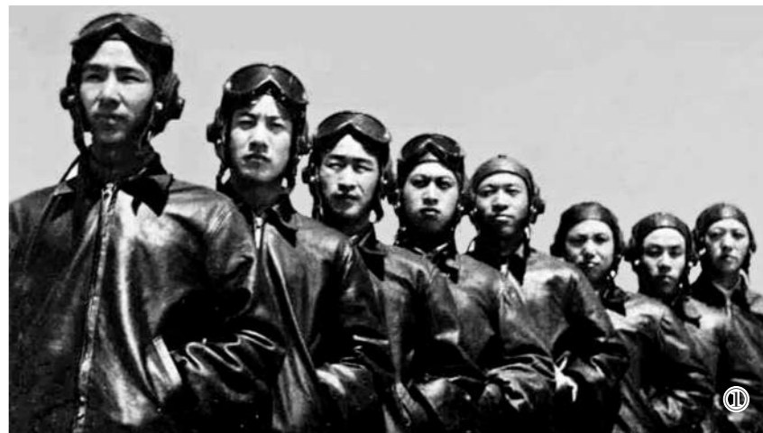
图①：抗美援朝中的“王海大队”。图②：新时代的“王海大队”。

抬眼望去，一架架战鹰呼啸而过。不久前，记者来到东部战区空军航空兵某旅。外场跑道上，暖阳融融，微风拂面。“王海大队”的飞行员驾驶战机升空训练。终于有了空闲，该旅一名干部接受采访，记者问起营区主干道旁石头上篆刻着的12个大字——“敢打必胜，敢为人先，敢于担当”。“这块‘敢’字石，是我们旅战斗精神的象征，也是王海同志等革命前辈用实际行动写下的铮铮誓言。”谈及旅队前身创造过的辉煌战绩，这名干部面露自豪。当年，年仅26岁的王海率领年轻的飞行大队，靠着敢于“空中拼刺刀”的血性，击落击伤敌机29架，在抗美援朝战场打出了一条令敌闻风丧胆的“米格走廊”。