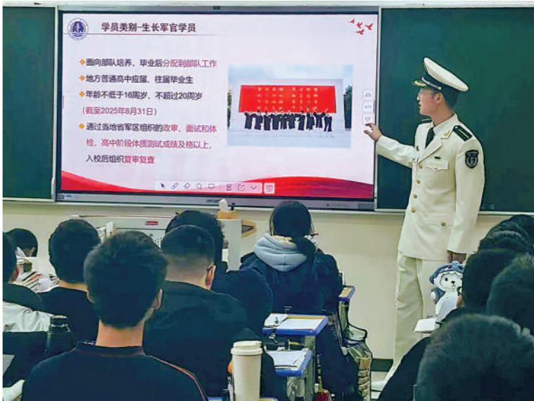
海军军医大学学员进行招生宣讲。