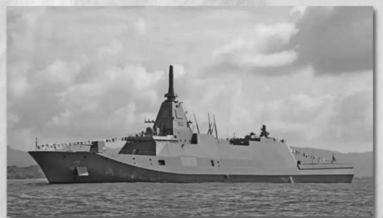
日本“最上”级护卫舰。

新闻事实：据日媒报道，日本政府计划于今年4月修改“防卫装备转移三原则”，相关内容包括：原则上允许出口杀伤性武器；武器出口无需国会事先批准，改为事后报告等。