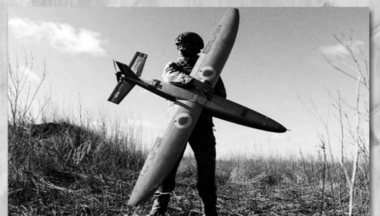
乌克兰“火星”攻击无人机。

新闻事实：近期，乌克兰与沙特、卡塔尔和阿拉伯三国签署防务合作协议，涉及无人机联合生产、反无人机与防空合作、国防工业联合项目开发、人员培训与技术支持等。