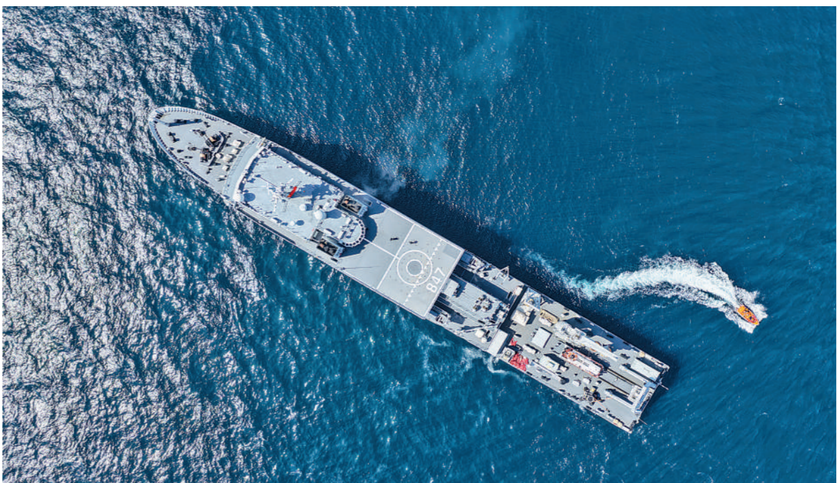
近日,北部战区海军某支队开展协同救援训练。

哈利德表示,阿中关系历史悠久、根基深厚,两国始终相互尊重、相互信任,有着广泛共同利益。阿方高度重视发展对华关系,愿同中方落实好两国元首达成的重要共识,深化各领域合作,为两国关系开辟更广阔前景,造福两国人民。阿方赞赏中国在国际事务中发挥负责任和建设性作用,为政治解决当前中东危机作出积极努力。阿方致力于同中方保持密切沟通协调,促进相关方面停火止战,尽快恢复地区和平稳定,维护国际航运安全,防止对全球经济和能源安全造成更大影响。阿方将切实保护在阿中国公民和机构安全。王毅参加会见。