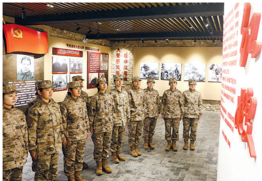
临沂市上半年预定新兵到沂蒙红嫂纪念馆参观见学。