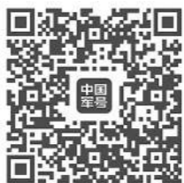
扫描二维码 聆听“雷锋原声”