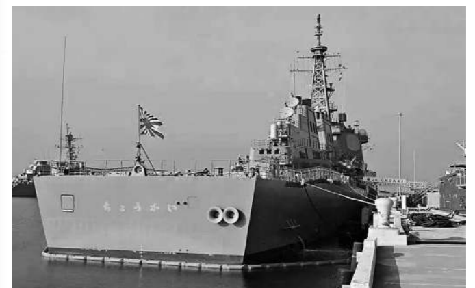
停泊在美国太平洋舰队军港的“鸟海”号驱逐舰。

新闻事实：据日媒报道，日本海上自卫队“宙斯盾”舰“鸟海”号近日在美国完成重大改装，初步具备发射远程攻击“战斧”巡航导弹能力。