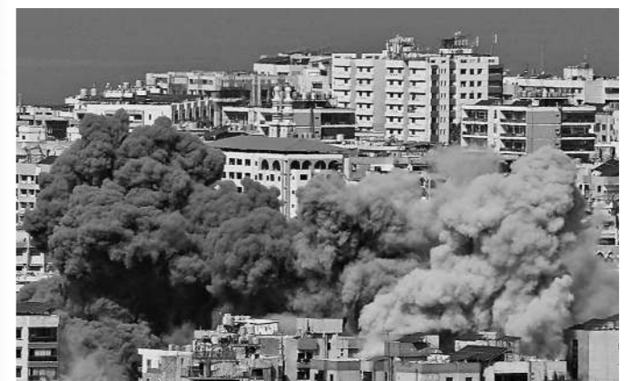
以色列轰炸黎巴嫩贝鲁特南郊哈雷赫特赫赖克地区。

新闻事实：以色列议会3月30日批准2026年预算案，其中，国防预算约453亿美元，创历史新高。