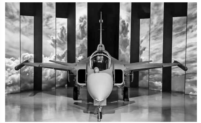
巴西首架国产“鹰狮”战斗机亮相。

新闻事实：据报道，巴西总统卢拉近日赴圣保罗州某机场，参加了首架在巴西组装的F-39E“鹰狮”战斗机的亮相仪式。