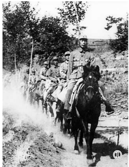
图①:1937年聂荣臻(前一)率领军区机关由山西西台向河北阜平进发,前三为刘显宜;图②:1941年聂荣臻致刘显宜的亲笔信。

8月的一天,红军主力下山转战,担任迫击炮连司务长的父亲留下来修理迫击炮。当时红军在黄洋界哨口只有2个连的兵力,4个团的敌军趁虚而入,双方展开了激烈战斗。正当红军弹药不足,情况万分紧急之时,父亲接到指挥战斗的第31团副团长兼第1营营长陈毅安通知,和几名战友扛着刚修好的迫击炮,还直接命中敌人的指挥所,引起连续爆炸。山上的红军和乡亲们跟着炮声摇旗呐喊,一时间鼓号齐鸣。敌人听出这是钢炮的声音,误以为是红军主力回来了,立刻全线溃退。后来,毛泽东同志用“黄洋界上炮声隆,报道敌军宵遁”的词句描述了这次战斗。当