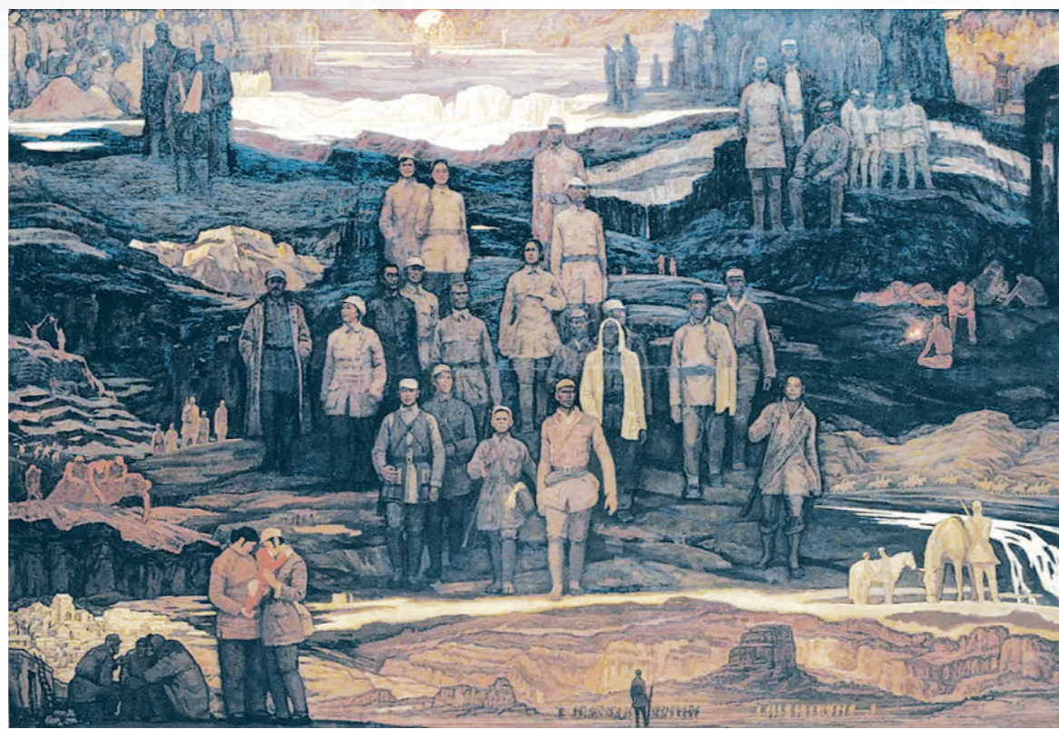
太行山上(油画 龙美术馆藏)

毛泽东指出,坚持抗日民族统一战线的总方针,“发动全军全民的全部积极性,为保卫一切未失地区、恢复一切已失地区而战,才能争取最后胜利”。