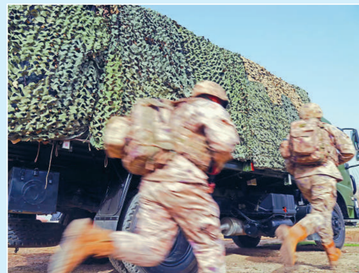
警戒防卫组奔向岗位。

营长：日志的演变，本质是官兵研战状态的升级。现在的日志，既是“错题集”，也是创新“孵化器”。一次伪装任务险些超时，针对问题大家集智攻关，研发出简易滑轨法，效率提升一半。从发现问题到解决问题，点燃了官兵研战谋战的内