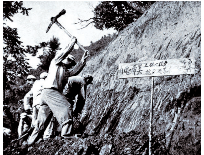
1953年夏季,志愿军战士在战斗间隙嵩山修筑工事。 资料照片

此次高阳岱东无名高地战斗,具有重要的意义。从战术层面看,战斗中志愿军官兵展现出极高的战术素养,能够根据战场态势灵活调整作战部署,将原定的大规模强攻迅速转为小分队夜袭,精准破解了敌军的诱饵企图。为志愿军在朝鲜战场复杂态势下开展山地夜战、阵地争夺战积累了宝贵的实战经验,进一步完善了“火力支援+小分队突击+坚守反击”的战术体系,为后续战斗提供了可借鉴的战术模板。从战役层面看,该高地的攻克与巩固,如一把尖刀插入敌军防线,打破了敌军在临津江西岸精心构建的防御部署,割裂了南山敌军与周边阵地的联系,使其陷入孤立无援的境地。从战略层面看,此次战斗的胜利沉重打击了南朝鲜军的嚣张气焰,使其深刻认识到志愿军强大的作战能力与钢铁般的战斗意志。这一胜利在停战谈判中为我方争取到了更为有利的态势,为战争的最终胜利贡献了重要力量。