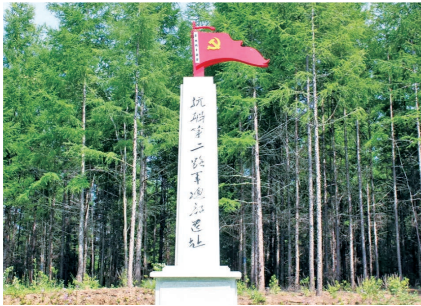
位于黑龙江省七台河市茄子河区宏伟镇京石泉村的东北抗联第二路军总部遗址。

个交通站,既加强了地区内部的组织联络,又通过吸纳大批工人、农民加入抗日队伍,不断壮大吉东的抗日力量,有效巩固了根据地政权。有了相对稳定的后方基地,吉东地区的游击战争得以快速发展;在特委的统一指挥下,各支抗日武装灵活开展机动作战,不仅成功瓦解日伪军对根据地的多次“讨伐”,还持续扩大游击范围,逐步将林口、勃利、密山、宝清、虎林等地连成一片。