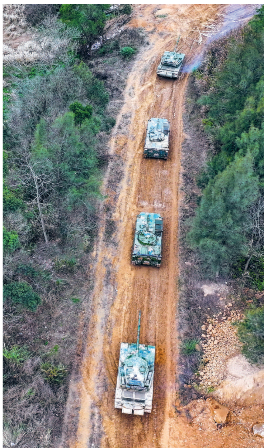
近日,陆军某旅装甲分队开展驾驶训练。

一件事的韧劲,甘做铺路工作,甘抓未成之事。坚持从实际出发、按规律办事,不驰于空想、不骛于虚声,一步一个脚印坚定朝前走,一个阶段一个阶段扎实推进,以真抓实干真出业绩、出真业绩。保持历史耐心和战略定力,坚持积小胜为大胜,既着眼未来谋划长远,又结合实际干在当下,多想事业少想自己,多担重任少些推诿,在显功与潜功的辩证统一中努力创造经得起实践、人民、历史检验的实绩。