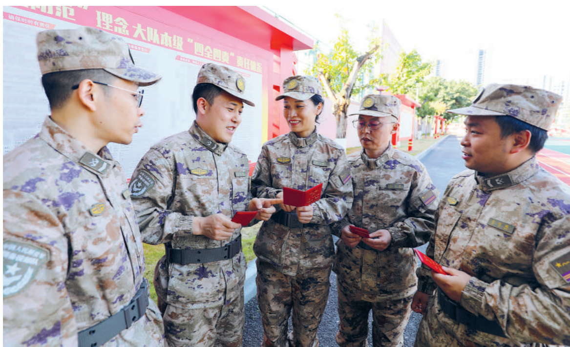
信息支援部队某部预备役人员领取到首批《中国人民解放军预备役人员证》。

早春,空军某部礼堂座无虚席,《中国人民解放军预备役人员证》(以下简称《预备役人员证》)集中发放仪式隆重举行。参加仪式的预备役人员军容严整,灯光照耀下,他们佩戴的预备役军衔熠熠生辉。随着证件发至预备役人员手中,现场响起经久不息的掌声。