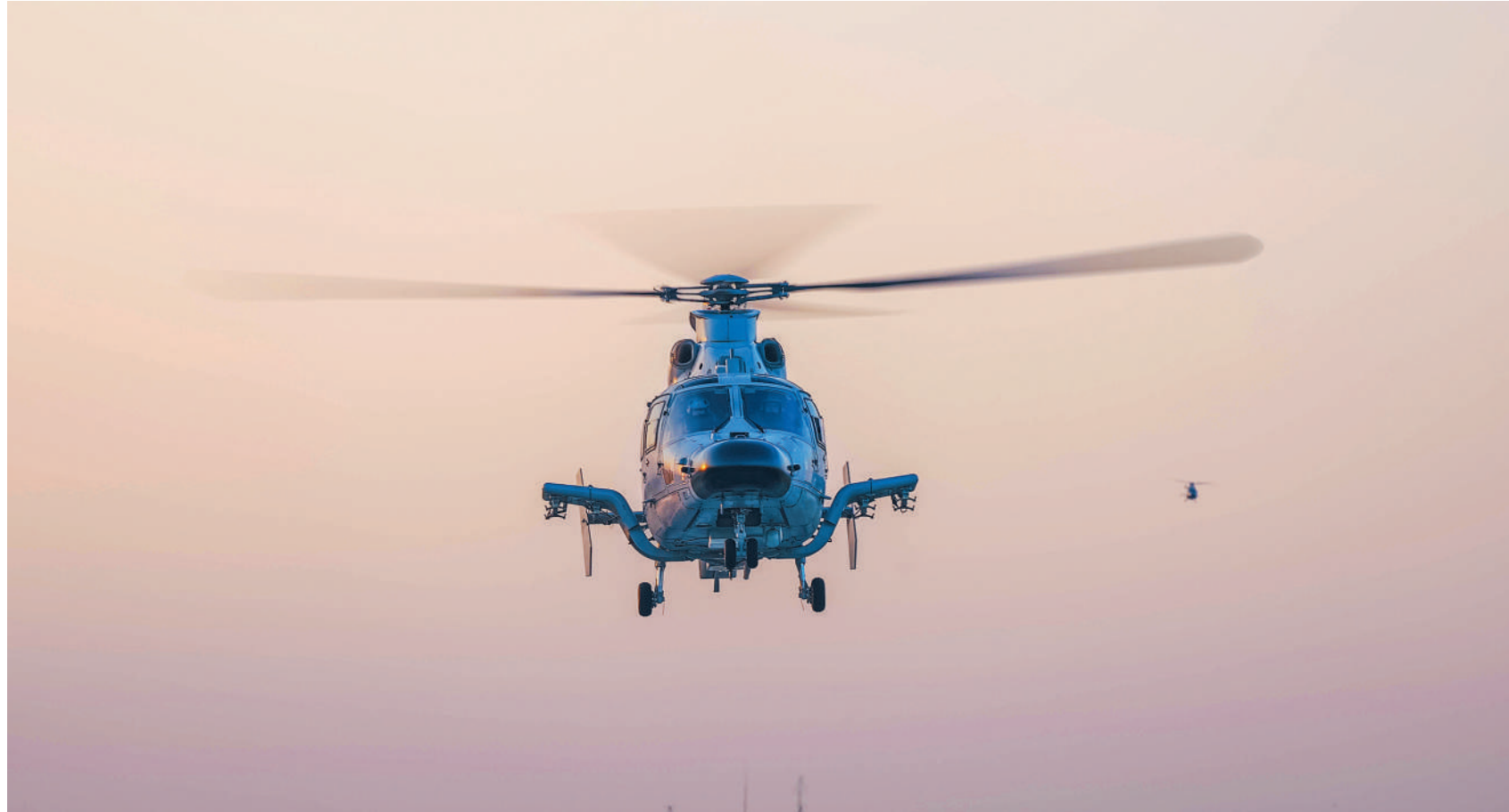
冬日,海军某部开展飞行训练。