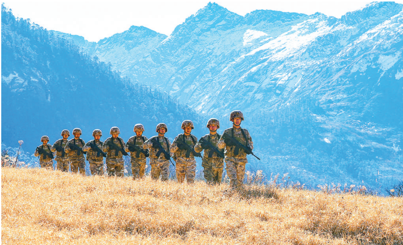
近日,西藏军区“墨脱戍边模范营”官兵执行巡逻任务。

坚持重遏制、强高压、长震慑,持续释放不松不退不让的强烈信号,彻底打消那些降调变调的期待、自恃手段高明的侥幸、企图蒙混过关的妄想。 切实扎牢不能腐的笼子。“牛栏关猫”喻指如果制度不健全,权力关不进制度的笼子,腐败分子就会钻空子。腐败的本质是权力滥用,反腐败必须强化对权力运行的制约和监督。坚持把制度建设摆在重要位置,上紧制度规矩发条,形成靠制度管权、管事、管人的长效机制。坚持以系统观念和改革办法补齐短板、堵塞漏洞、深化治理,把“关猫的牛栏”变成“严密的铁笼”,让胆敢腐败者在严格监督约束中难有可乘之机。 不断增强不想腐的自觉。列宁曾说,“政治上有教养的人是不会贪污受贿的”。各级应持续深化政治整训,起底深挖变异隐藏的思维惯性、行为偏差和不良做派,引导党员干部主动把自己摆进去、把职责摆进去、把工作摆进去,解决好理想信念、党性修养、官德人品等思想根子问题。坚持党性党风党纪一起抓,引导党员干部自觉净化“三圈”,纯正家风家教,以自身正、自身硬、自身净带动形成全面从严的示范效应。