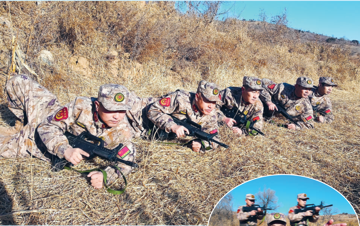
12月上旬，辽宁省葫芦岛市连山区人武部组织民兵开展专业训练，提升支援保障能力。 上图：民兵进行基础动作训练。 右图：民兵进行3人协同战术训练。

为进一步丰富教育资源，他们还联合地方宣传、文旅等部门，与柯柯牙纪念馆、三五九旅屯垦纪念馆等8个红色教育基地建立联系，定期组织官兵参观见学；聘请地方党校教授、援疆干部、参战老兵、老党员等担任“客座教员”，打造“行走的教育课堂”。 如今，该军分区的教育区域协作机制日趋完善，形成了“资源共享无壁垒、教学相长有活力、学用转化见实效”的良好局面。今年以来，该军分区各级已开展军地联合教育活动5场次，覆盖官兵9000余人次。