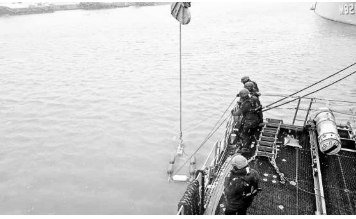
北约参演官兵在演习中作业。

新闻事实: 近日,由芬兰海军主导的“寒风 25”海上联合军演在波罗的海启动。共有来自 11 个北约国家的 20 艘军舰、近 5000 名士兵参演,演习一直持续到 12 月 4 日。