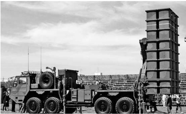
日本 03 式中程地空导弹。

新闻事实: 近日,日本防卫大臣小泉进次郎表示,向与那国岛部署 03 式中程地空导弹的计划正快速推进。日方这一动作遭到多国强烈反对。