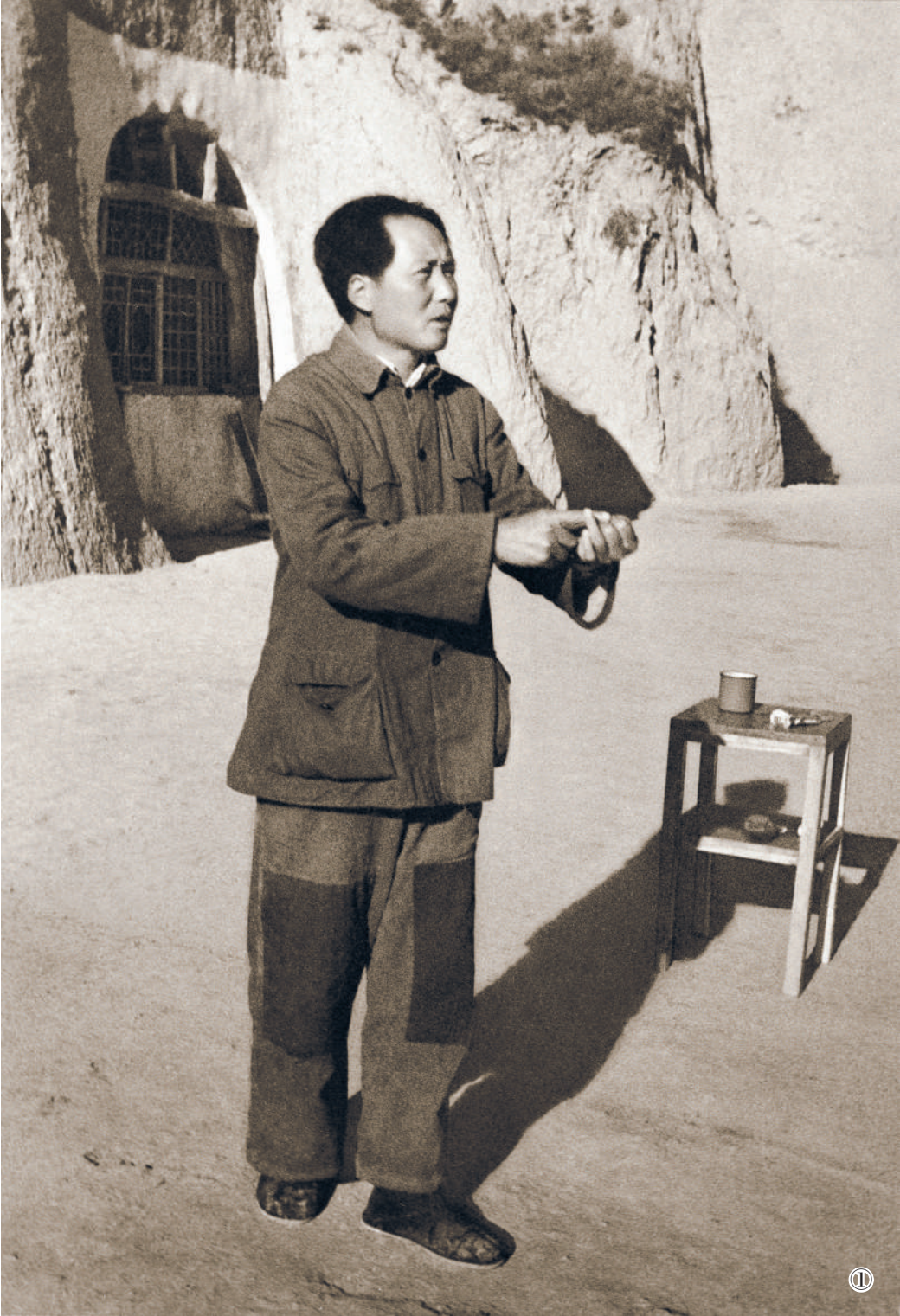
图①:1942年初夏,毛泽东同志在延安给八路军120师干部作报告。

胜强敌者先胜己。进入新时代,我军在强军征程上继续推进正风肃纪,以自我革命的勇气解决自身问题。深化政治整训,就是要深入反思在对党忠诚、使命责任和政绩观、权力观、群众观等方面存在的问题差距,敢于揭短亮丑,触动灵魂,深入检视查纠问题,推动政治建军走深走实。