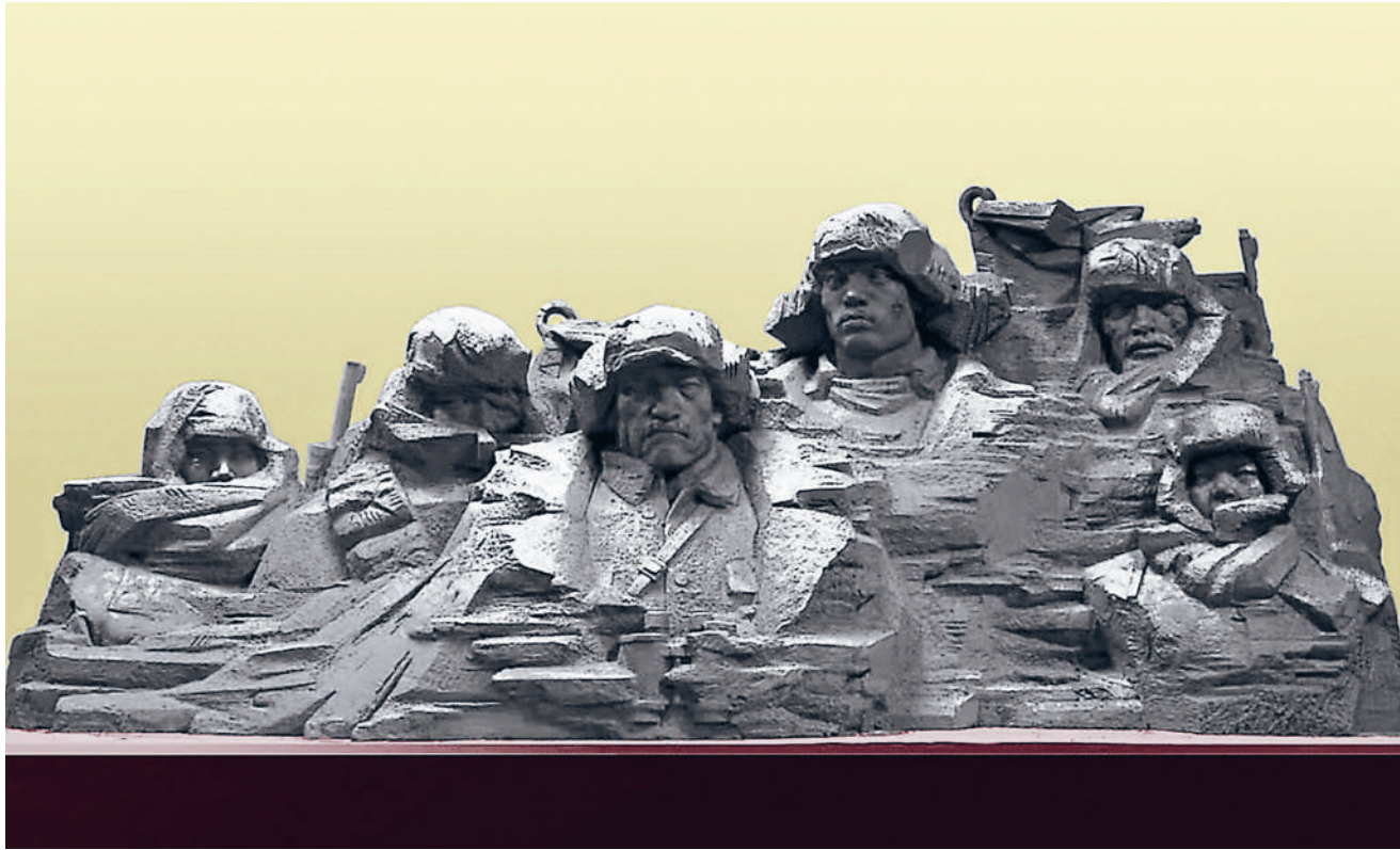
山魂(雕塑,安徽省美术馆纪念抗战胜利80周年“历史的塑痕:雕塑里的峥嵘岁月”特展作品。创作者将东北抗联战士形象与山体结构相融合,以山为喻,诠释抗战英雄坚贞不屈的担当与奉献。)