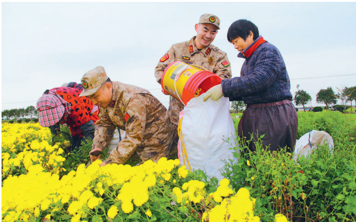
十一月下旬,江苏省射阳县洋马镇武装部组织民兵帮助村民抢收菊花。

截至目前,桐乡市200多个村社中,“兵支书”数量已超过100名,“兵委员”近300名,覆盖所有镇(街道),一支政治过硬、作风扎实、群众认可的老兵队伍在基层扎根。