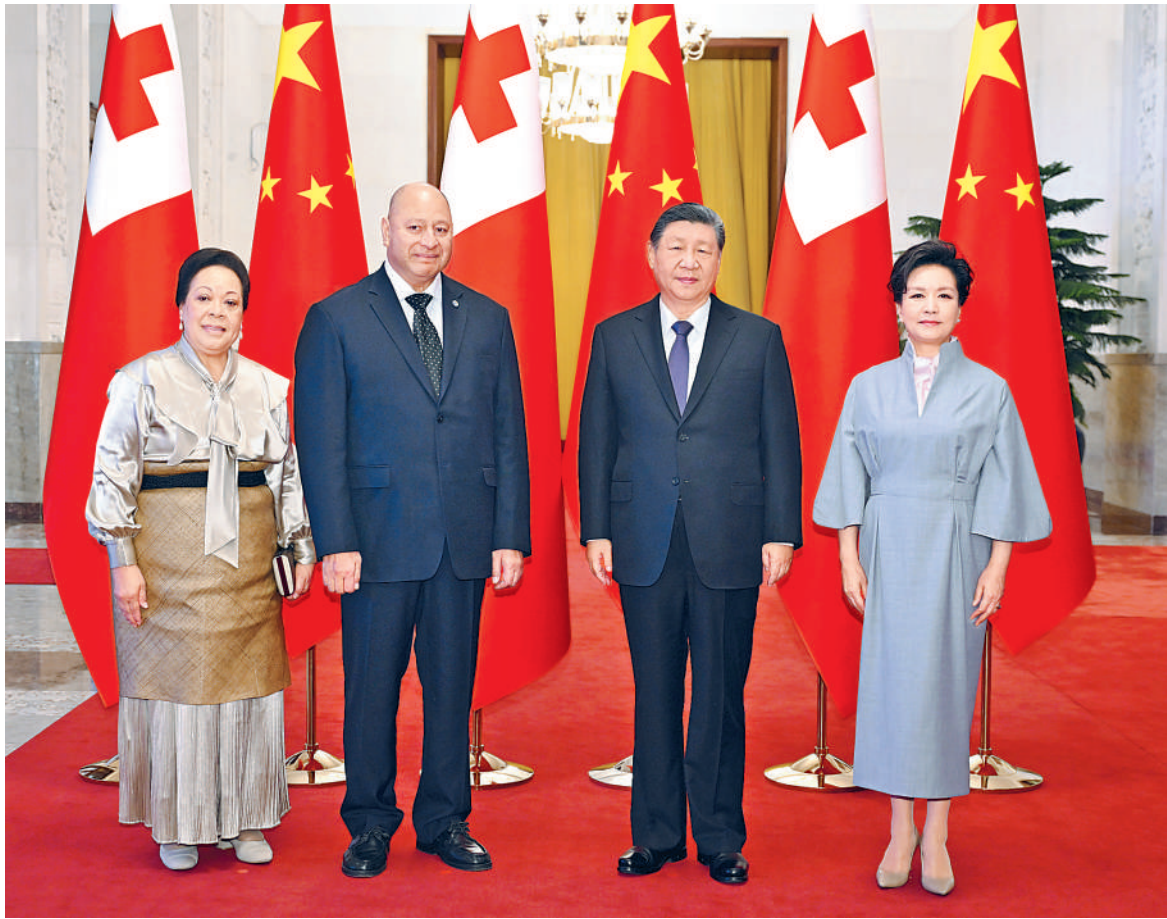
十一月二十五日上午，国家主席习近平在北京人民大会堂会见来华进行国事访问的汤加国王图普六世。这是习近平和夫人彭丽媛同图普六世和王后娜娜合影。