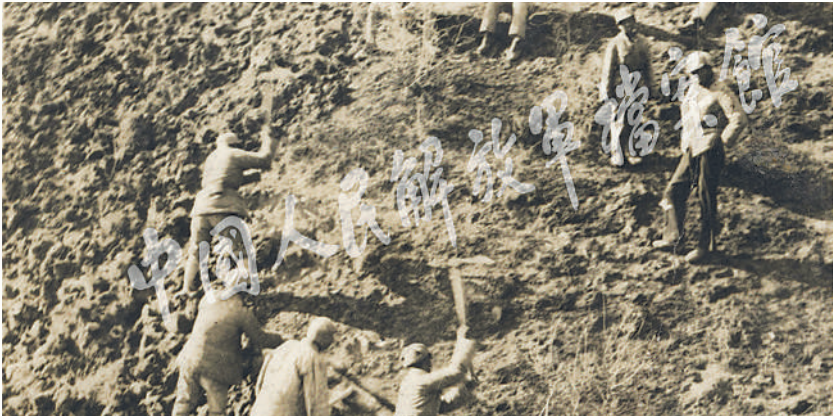
在南泥湾大生产运动中，我军战士们用锄头开荒。

党。档案里记载着他的铮铮誓言：“党把我养起来，我绝不会辜负党，要做一个好党员！”