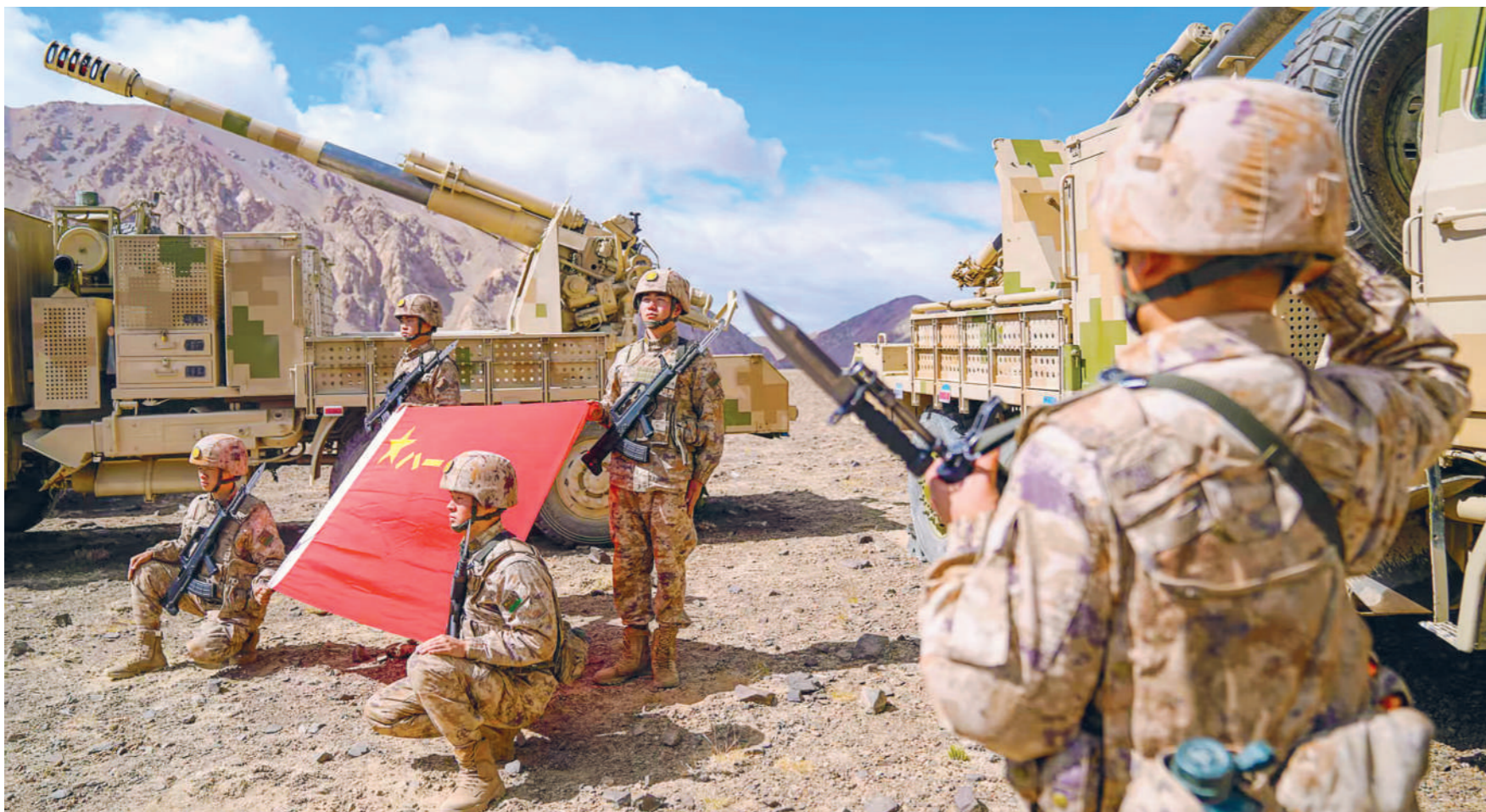
“八一”前夕,新疆军区某团组织开展“边关有我,请祖国放心”主题活动,进一步激发官兵扎根边防、无私奉献的热情。图为官兵面向军旗宣誓。