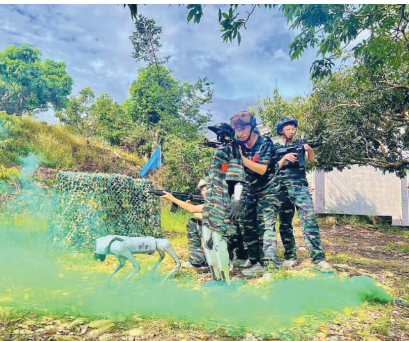
近日,广东省广州市番禺区军地组织学生开展国防教育主题夏令营活动,通过沉浸式体验AI军事应用、智能装备操作、战术模拟对抗等,增强学生国防观念,激发科技报国热情。