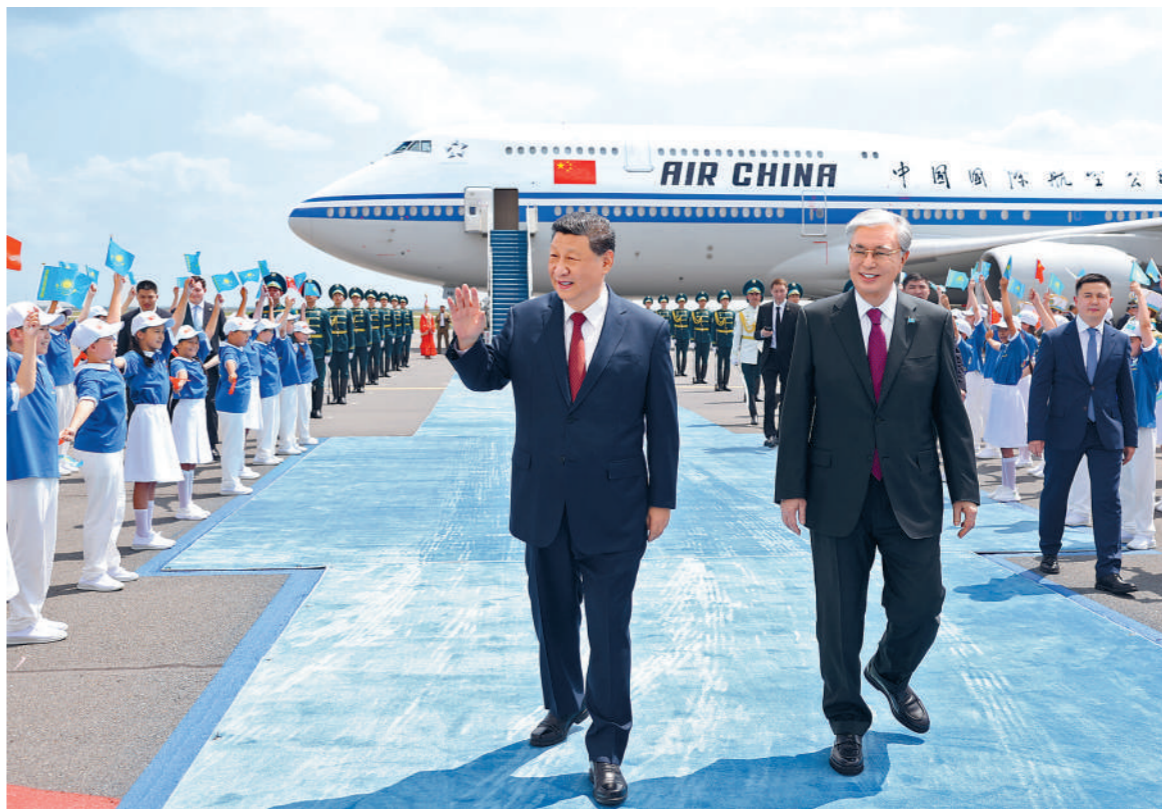
当地时间六月十六日中午，国家主席习近平乘专机抵达阿斯塔纳，应哈萨克斯坦共和国总统托卡耶夫邀请，出席第二届中国—中亚峰会。这是习近平向欢迎人群挥手致意。