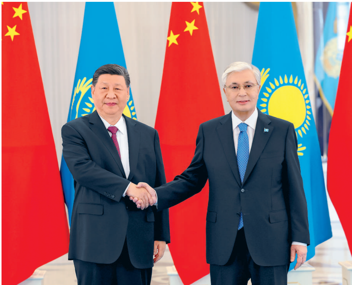
当地时间六月十六日下午，哈萨克斯坦总统托卡耶夫同中国国家主席习近平在阿斯塔纳总统府举行会谈。