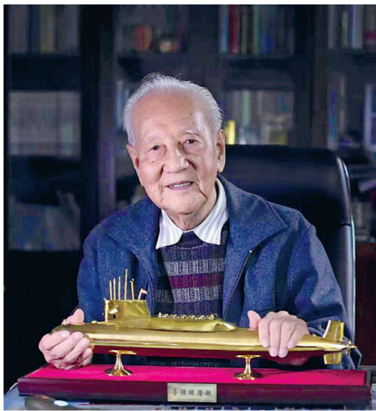
黄旭华院士手持潜艇模型的照片。

2016年，黄旭华应中央电视台邀请作了题为《此生无悔》的演讲，深情回顾了自已隐姓埋名30多年间，父母、妻子、女儿对他的默默支持，也袒露了他们这代科学家炽热的家国情怀。他说：“核潜艇战线广大员工，他们呕心沥血、淡泊名利、隐姓埋名，他们奉献了一生最宝贵的年华，还奉献了终生。如果你要问他们这一生有何感想，他们会自豪地说：这一生没有虚度。再问他们，你们对此生有何评述，那他们会说：自己是中华民族的儿女，此生属于祖国，此生属于事业，此生属于核潜艇，此生无怨无悔！”