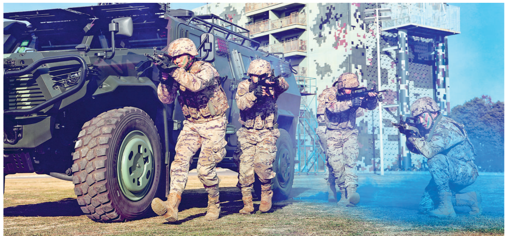
近日，武警安徽总队铜陵支队开展战术协同训练，锤炼官兵遂行任务能力。

这名连队主管对此有些不解，明明刚栽了跟头，怎么就是不长记性？其实，很多带兵人都有类似困惑：昨天刚栽了