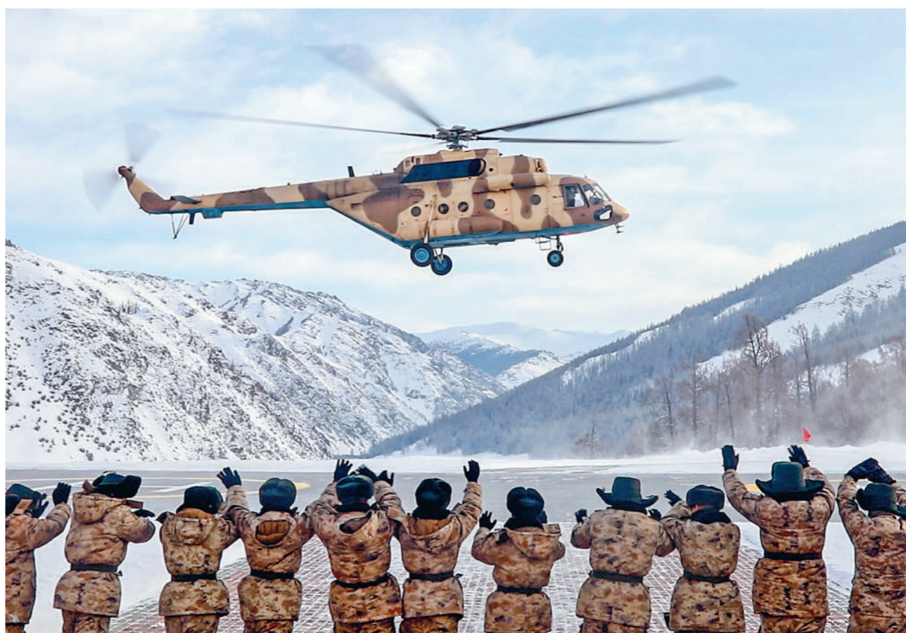
1月下旬，新疆军区某陆航旅派出运输直升机，赴天山南麓边沿执行任务。图为连队官兵向机组人员挥手告别。