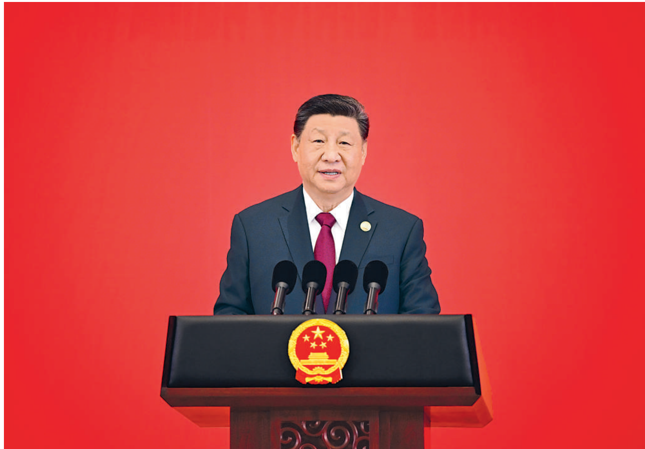
2月7日中午，国家主席习近平和夫人彭丽媛在黑龙江省哈尔滨市太阳岛宾馆举行宴会，欢迎来华出席哈尔滨第九届亚洲冬季运动会开幕式的国际贵宾。这是习近平发表致辞。