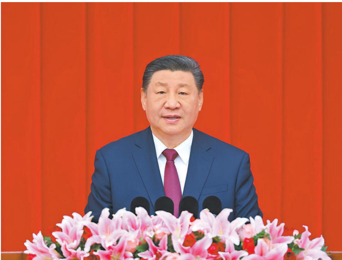
12月31日,全国政协在北京举行新年茶话会。中共中央总书记、国家主席、中央军委主席习近平在茶话会上发表重要讲话。