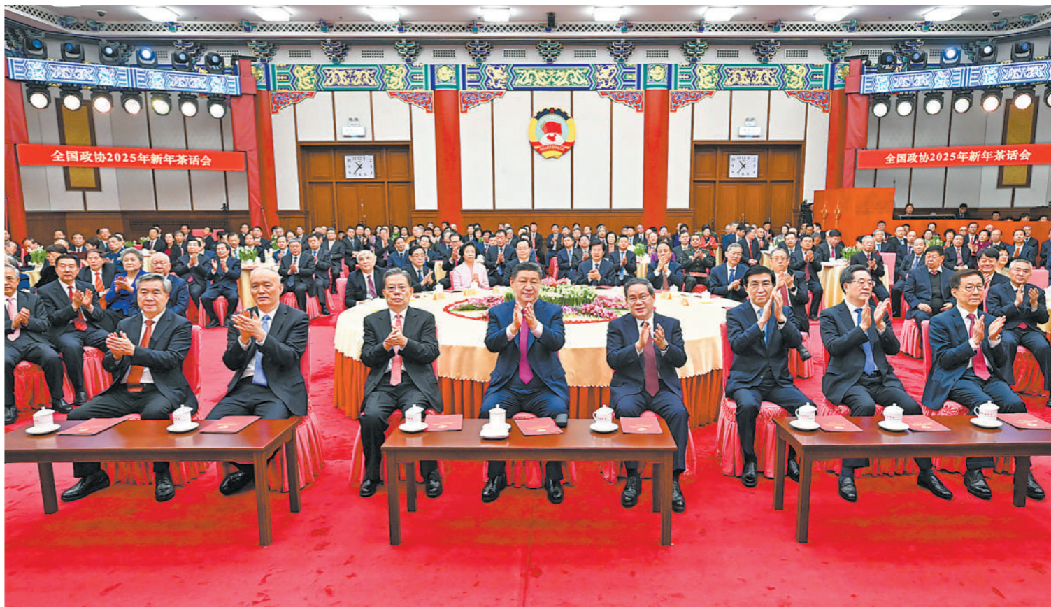
12月31日,全国政协在北京举行新年茶话会。党和国家领导人习近平、李强、赵乐际、王沪宁、蔡奇、丁薛祥、李希、韩正出席茶话会并观看演出。