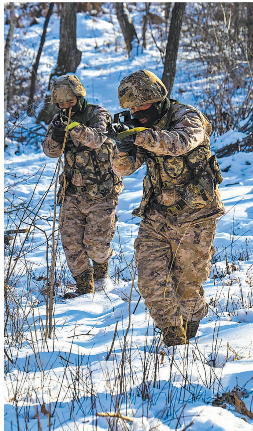
12月中旬，沈阳联勤保障中心某部开展冬季适应性训练。图为警卫分队在雪地里开展战术训练。