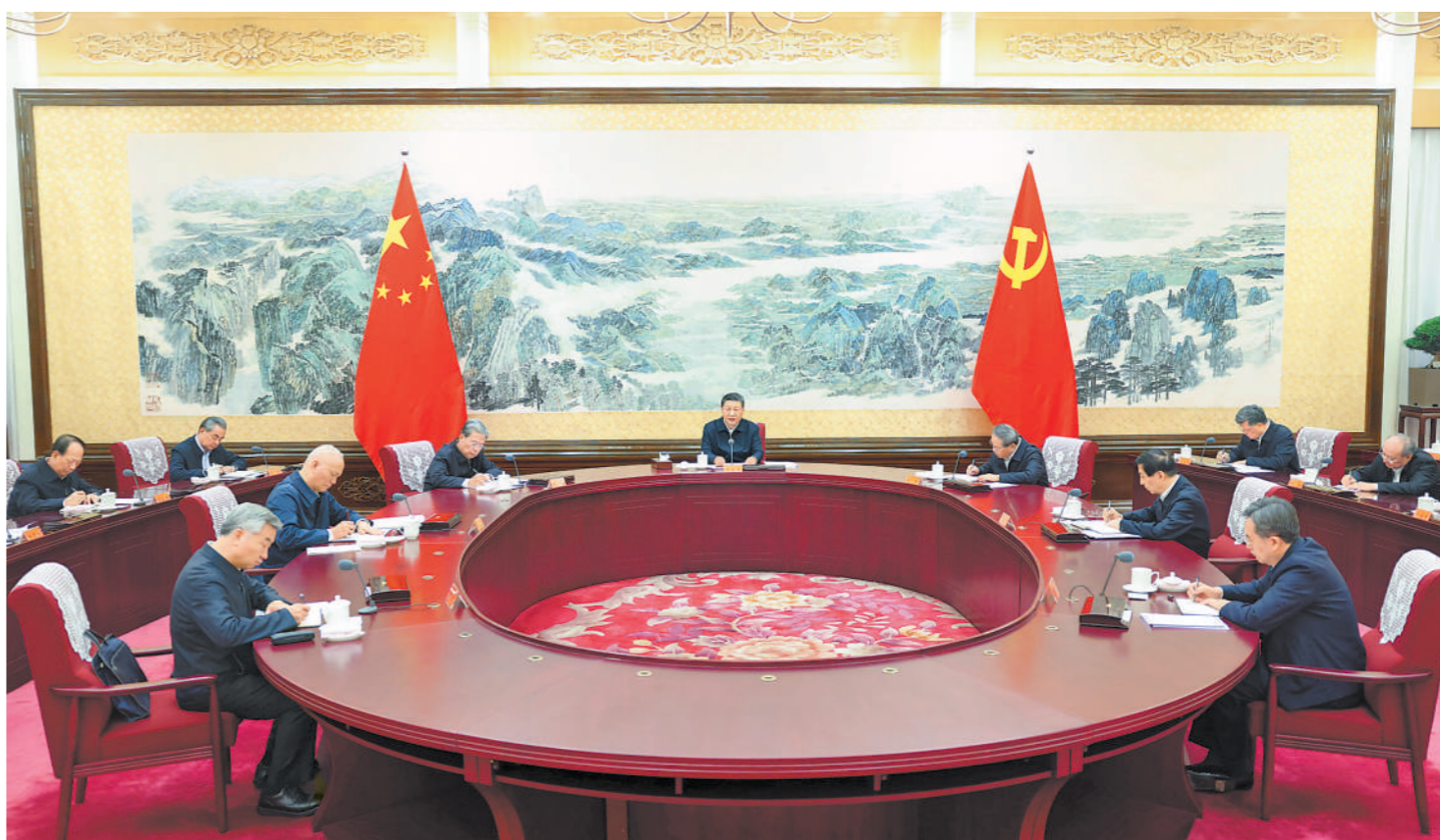
12月26日至27日,中共中央政治局召开民主生活会,中共中央总书记习近平主持会议并发表重要讲话。

新华社北京12月27日电 中共中央政治局于12月26日至27日召开民主生活会,深入学习贯彻习近平新时代中国特色社会主义思想,围绕巩固深化党纪学习教育成果、综合发挥党的纪律教育约束和保障激励作用,把学习贯彻纪律处分条例、落实中央八项规定执行情况作为检查的重要内容,结合思想和工作实际进行自我检视、党性分析,开展批评和自我批评。 中共中央总书记习近平主持会议并发表重要讲话。 会前,有关方面做了认真准备。中央政治局同志同有关负责同志谈心谈话,听取意见建议,撰写发言提纲。会上,先听取关于2024年中央政治局贯彻执行中央八项规定情况的报告和关于2024年整治形式主义为基层减负工作情况的报告。中央政治局的同志逐个发言,围绕会议主题,对照《中国共产党纪律处分条例》、《中共中央政治局关于加强和维护党中央集中统一领导的若干规定》、《中共中央政治局贯彻落实中央八项规定实施细则》,认真查摆、深刻剖析,开诚布公、坦诚相见,气氛严肃活泼,收到预期效果。 中央政治局同志的发言,聚焦5个重点。一是维护党中央权威和集中统一领导更加坚定;二是服务人民、造福人民的价值追求更加坚定;三是落实党中央决策部署更加坚定;四是带头学纪知纪明纪守纪更加坚定;五是履行从严管党治党政治责任更加坚定。 会议强调,今年以来,面对国内外形势带来的挑战,党中央团结带领全党全国各族人民,沉着应变、综合施策,顺利完成经济社会发展主要目标任务,中国式现代化迈出新的坚实步伐。民生保障扎实有力,社会大局保持稳定,推进社会主义民主法治建设取得新成效,中国特色大国外交开创新局面,全面从严治党向纵深推进。这些成绩来之不易。 中央政治局的同志一致认为,以习近平同志为核心的党中央集中统一领导是做好一切工作的根本保证,确保中国式现代化航船乘风破浪、行稳致远。全党必须深刻领悟“两个确立”的决定性意义,增强“四个意识”、坚定“四个自信”、做到“两个维护”,坚定不移贯彻落实党中央方针政策和决策部署。明年是“十四五”规划收官之年,要坚持以习近平新时代中国特色社会主义思想为指导,全面贯彻党的二十大和二十届二中、三中全会精神,坚持稳中求进工作总基调,完整准确全面贯彻新发展理念,加快构建新发展格局,扎实推动高质量发展,进一步全面深化改革,扩大高水平对外开放,推动经济持续回升向好,不断提高人民生活水平,保持社会和谐稳定,坚定不移全面从严治党,高质量完成“十四五”规划目标任务,为实现“十五五”良好开局打牢基础。