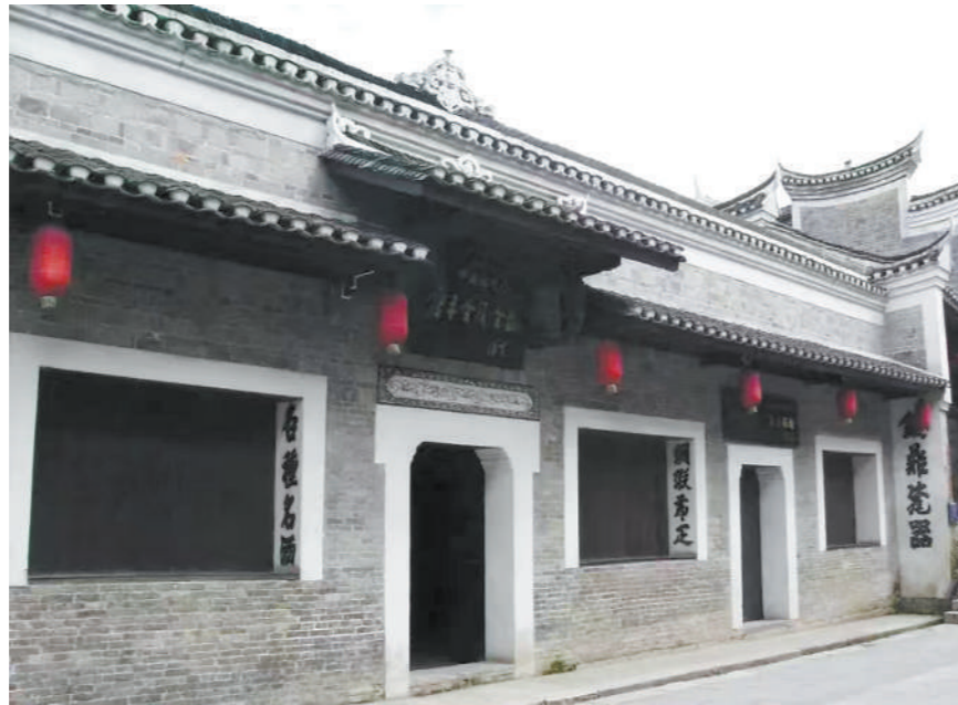
黎平会议会址（原“胡荣顺”店铺）。

在贵州省黎平县城中心有一条街道，因其地势两头高、中间低，形似翘起的扁担而得名“翘街”。90年前，中共中央在这里召开了长征途中的第一次政治局会议，决定由北上湘西改为西进贵州，从根本上改变了中央红军战略进军的方向。当地群众形象比喻道：“一根挑起过红军长征重担的‘翘扁担’，它使红军一进入黎平就看到了黎明。”由此，黎平作为红军长征入黔的第一站，又被誉为“曙光之城”。