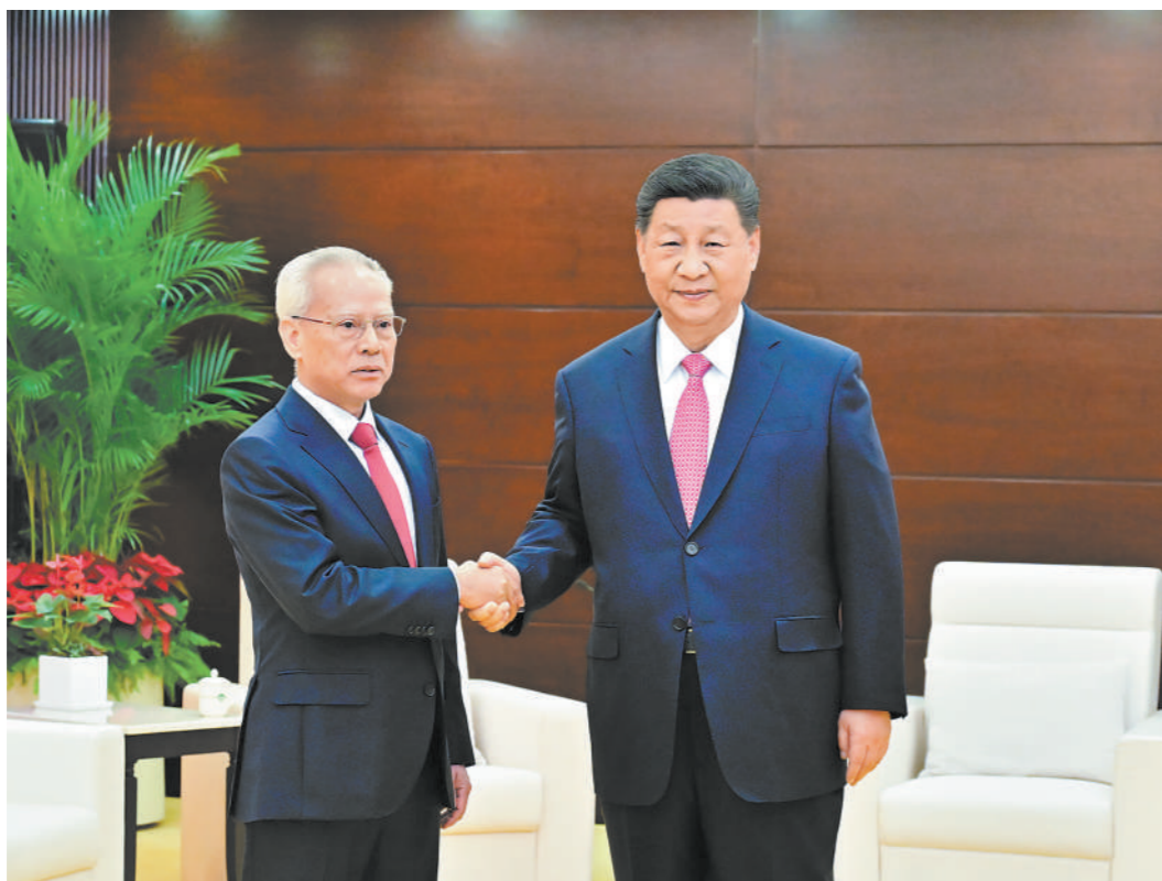
12月20日上午,国家主席习近平在澳门会见刚刚就职的澳门特别行政区行政长官岑浩辉。

习近平祝贺岑浩辉就任澳门特别行政区第六任行政长官。他表示,相信岑浩辉行政长官定能恪尽职守、不负重托,团结带领新一届澳门特别行政区政府和各界,全面准确、坚定不移贯彻“一国两制”、“澳人治澳”、高度自治的方针,坚决维护国家主权、安全、发展利益,大力推动经济适度多元发展,持续增进民生福祉,充分发挥澳门的独特地位和优势,更好融入国家发展大局,深化同各国各地区交往合作,为澳门更好发展作出更大贡献。中央政府将全力支持岑浩辉行政长官和特别行政区政府履职。