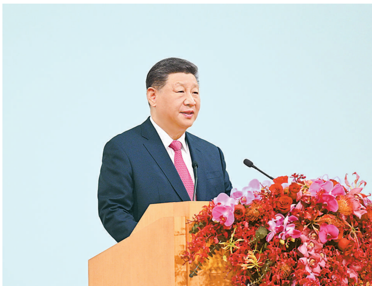
12月20日上午,庆祝澳门回归祖国25周年大会暨澳门特别行政区第六届政府就职典礼在澳门东亚运动会体育馆隆重举行。中共中央总书记、国家主席、中央军委主席习近平出席并发表重要讲话。

习近平指出,澳门回归祖国25年来,具有澳门特色的“一国两制”实践取得巨大成功,澳门发生翻天覆地的变化,国际影响力大幅提升。希望新一届澳门特别行政区政府团结带领社会各界,抢抓机遇、锐意改革、担当作为,更好发挥“一国两制”制度优势,不断开创“一国两制”事业高质量发展新局面