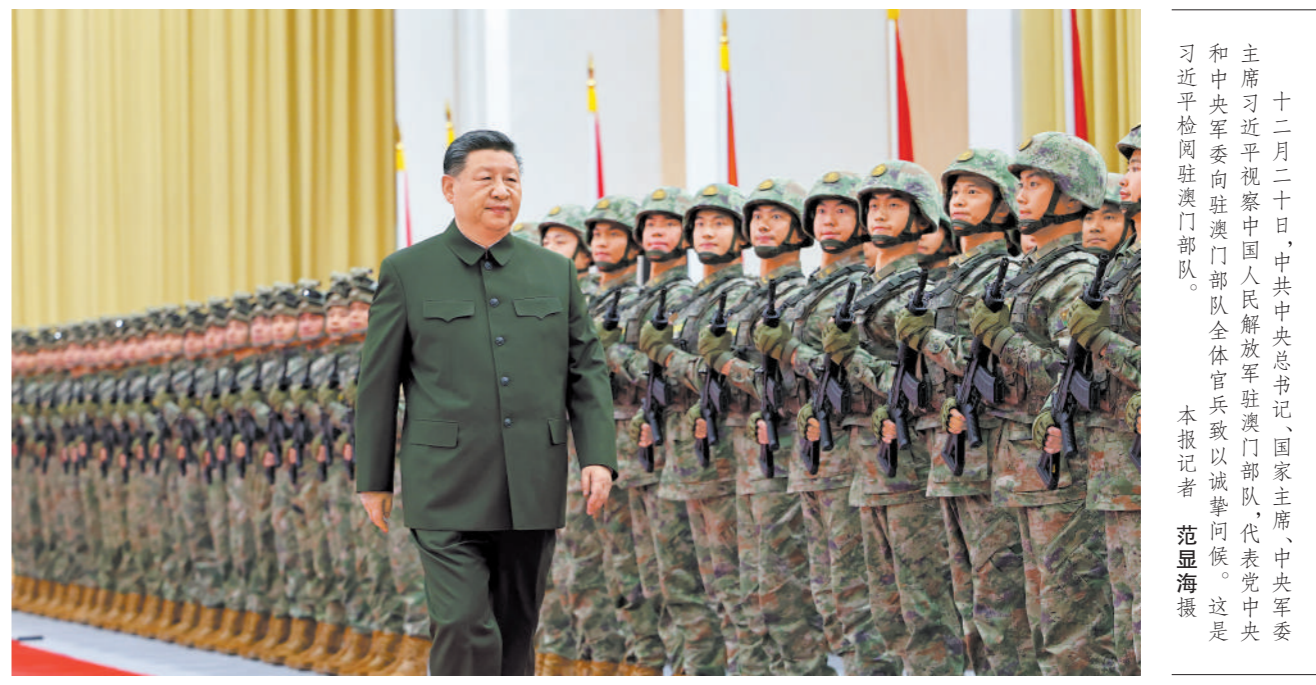
十二月二十日,中共中央总书记、国家主席、中央军委主席习近平视察中国人民解放军驻澳门部队,代表党中央和中央军委向驻澳门部队全体官兵致以诚挚问候。这是习近平检阅驻澳门部队。

本报澳门12月20日电 记者欧灿、严珊珊报道:出席庆祝澳门回归祖国25周年活动的中共中央总书记、国家主席、中央军委主席习近平,20日视察