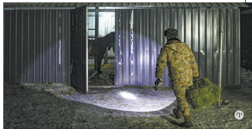
图①:连队官兵骑马巡逻。 图②:清晨,官兵在某执勤点位升起国旗。 图③:官兵在哨楼上执勤瞭望。 图④:深夜,一名战士去喂军马。 图⑤:连队“雪绒乐队”成员利用休息时间排练歌曲。

采访期间,记者跟随官兵在零下30多摄氏度的冰天雪地里站岗、巡逻。风如刀削,脱掉手套,双手瞬间便冻得麻木、僵硬。官兵们在恶劣环境中表现出的乐观与坚强,令人感动,也让我们对边关战士枕戈待旦、忠诚践行使命的责任担当有了深切感受。