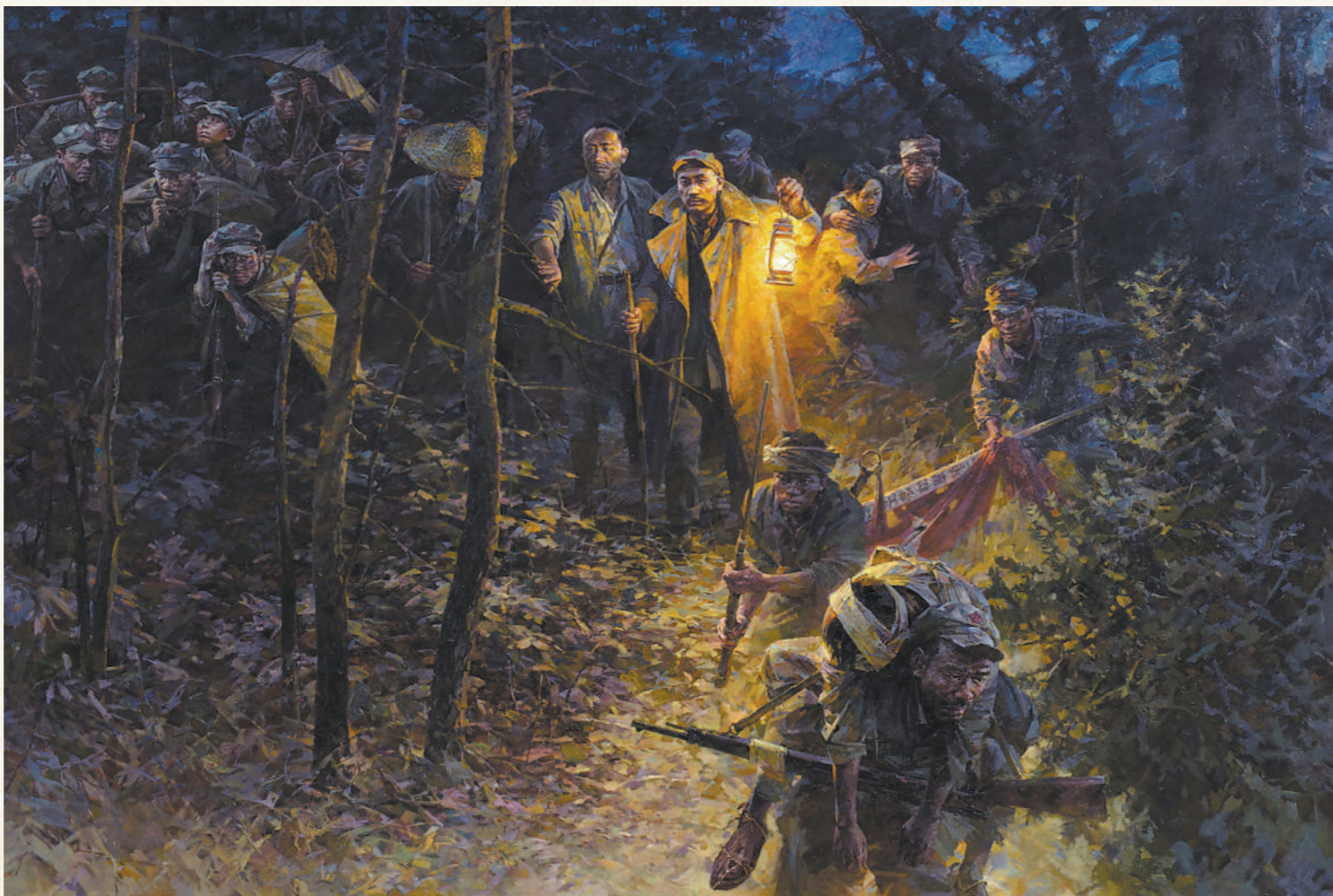
梅岭寒夜(油画) 中国共产党历史展览馆藏

不管时光怎样流转,苍茫大地上,总有一些人和事物,如夜空璀璨明亮的星,如古老的梅关,会成为人们长久仰望的深邃记忆。