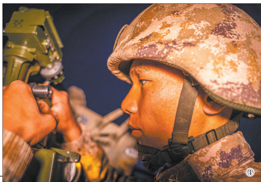
图①:夜间打击目标。 图②:向预定地域机动。 图③:官兵奔赴战位。 图④:修正射击诸元。