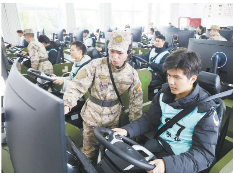
近日,火箭军某部迎来驻地高校学生代表,通过军事课目演示、参观荣誉室等活动,让学生们了解国防知识,增强国防意识。图为学生体验军车驾驶模拟训练。