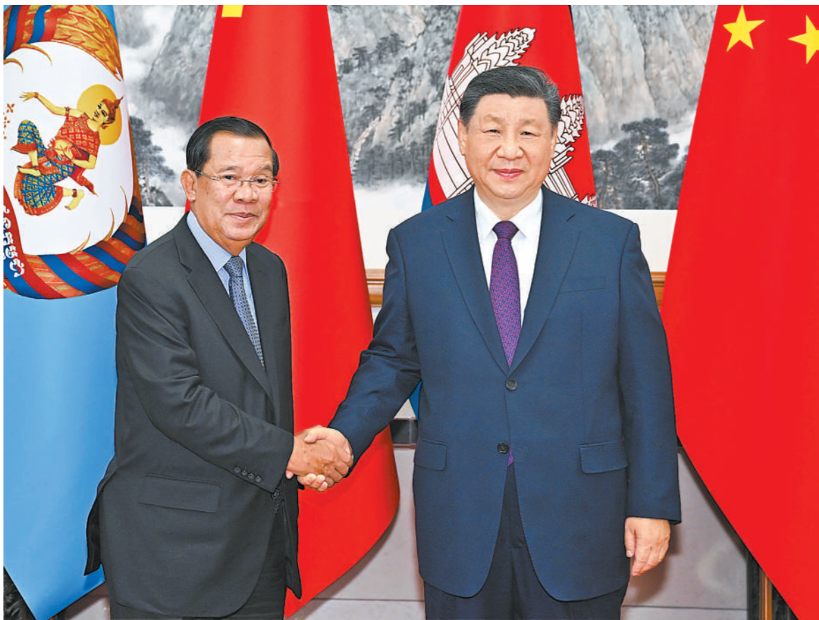
十二月三日,中共中央总书记、国家主席习近平在北京钓鱼台国宾馆同柬埔寨人民党主席、参议院主席洪森举行会谈。

新华社北京12月3日电 (记者马卓言)12月3日,中共中央总书记、国家主席习近平在北京钓鱼台国宾馆同柬埔寨人民党主席、参议院主席洪森举行会谈。 习近平表示,中柬铁杆友谊成色十足,完全符合两国人民共同利益。中方始终将柬埔寨作为周边外交重点方向,愿同柬方携手打造高质量、高水平、高标准的新时代中柬命运共同体。双方一要坚定相互支持,巩固铁杆友谊。中方将坚定支持柬埔寨维护国家主权、安全、发展利益。二要深化交流互鉴,共谋发展振兴。中国共产党愿同柬埔寨人民党加强战略沟通,助力柬埔寨探索符合本国国情的发展道路。三要把握合作机遇,开拓共赢新局。中方愿