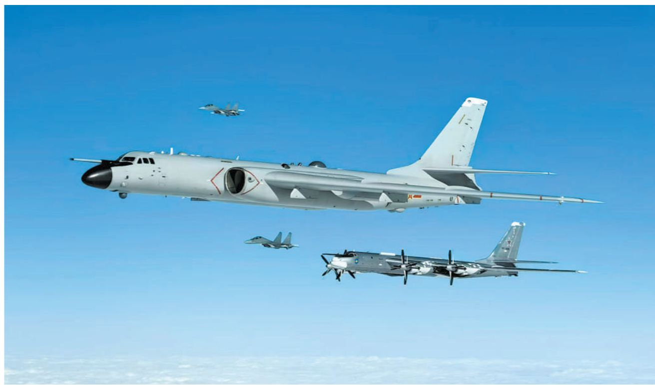
本报北京11月29日电 肖航、记者李建文报道:根据中俄两军年度合作计划,双方于29日在日本海相关空域组织实施第9次联合空中战略巡航。

这是自2019年以来两军组织的第9次空中战略巡航,旨在有效检验提升两国空军的联合训练和行动能力。