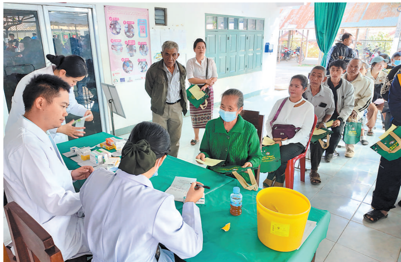
近日,中老“和平列车-2024”人道主义医学救援联合演习在老挝举行。演习结束后,中方参演卫勤分队在老挝多地巡诊,为当地民众提供优质医疗服务。图为巡诊现场。