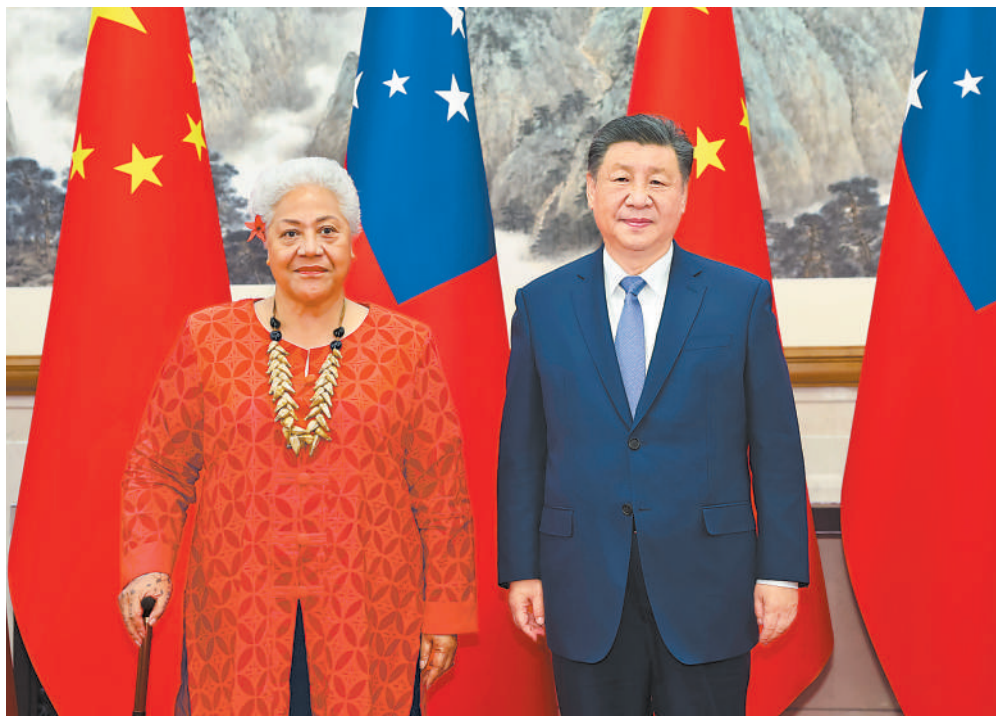
11月26日下午,国家主席习近平在北京钓鱼台国宾馆会见来华进行正式访问的萨摩亚总理菲娅梅。

新华社北京11月26日电 (记者冯敬然、曹嘉玥) 11月26日下午,国家主席习近平在北京钓鱼台国宾馆会见来华进行正式访问的萨摩亚总理菲娅梅。 习近平指出,萨摩亚在太平洋岛国中第一批同新中国建交。建交近50年来,两国保持传统友好,始终相互尊重、平等相待、合作共赢。中方一贯主张,国家不分大小一律平等,都有独立自主实现现代化的权利。中方坚定支持萨方维护自身主权和独立,自主探索符合本国国情的发展道路,愿同萨方坚持互尊互信,加强治国理政和发展经验交流,继续在南海合作框架内为萨摩亚经济社会发展提供帮助,深挖经贸、投资、农业等领域潜力,拓展互利合作,实现共同发展。双方要促进文明互鉴,加强教育、文化、青年等