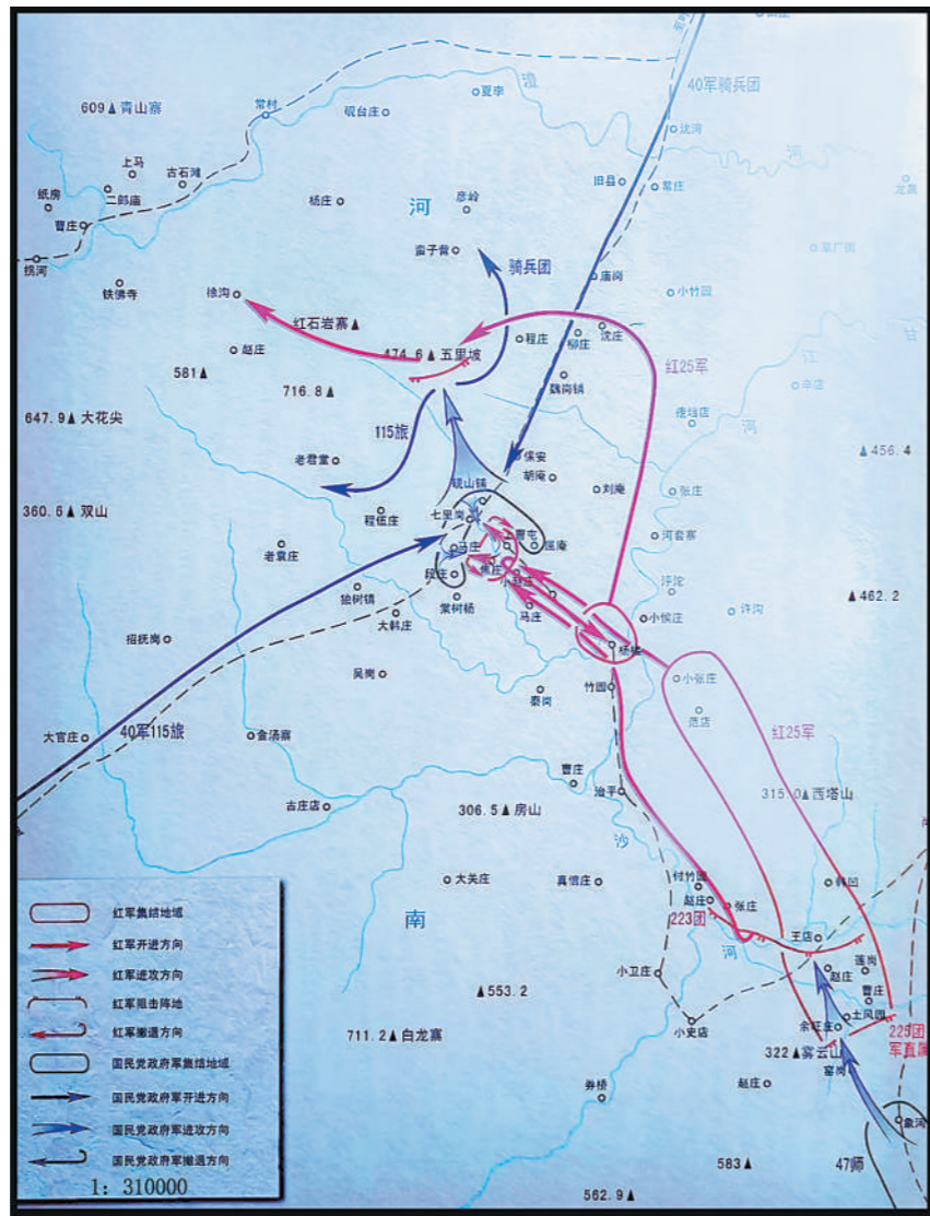
1934年11月25日至27日,独树镇地区战斗要图。 资料图片

决定以第224团为先头部队,手枪团紧随其后,第225团在最后保护省委和军部机关,依次行军,直奔七里岗。