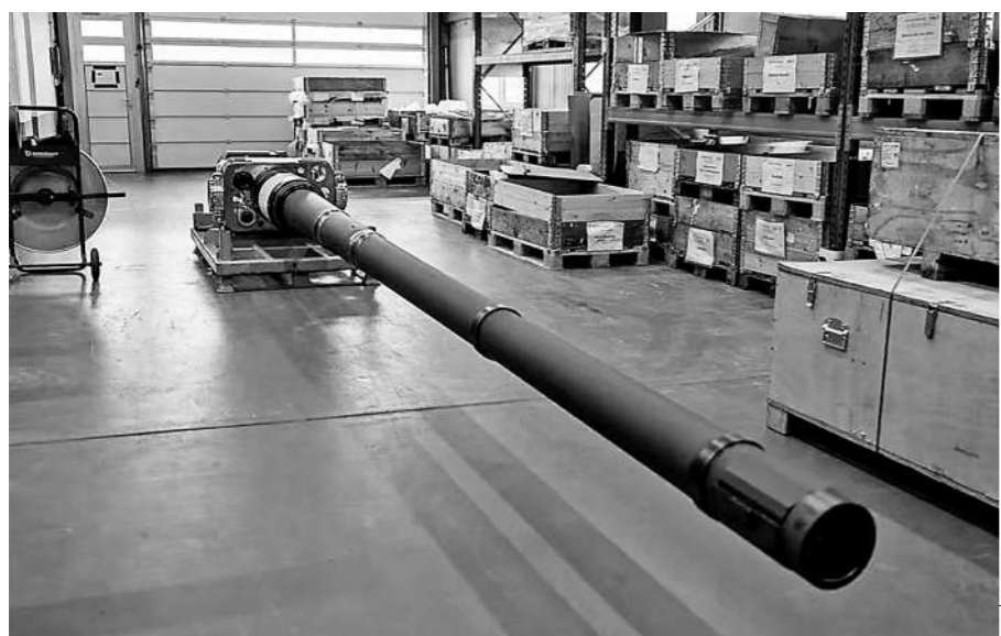
上图：德国空军装备的英德两国参与研发的“台风”战斗机。