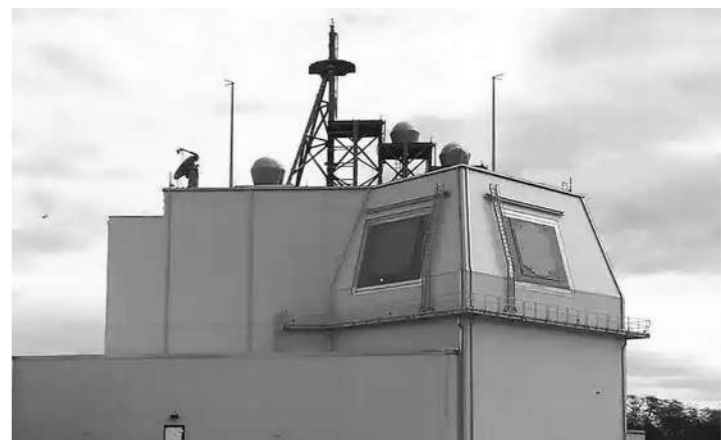
美国陆基“宙斯盾”反导系统设施。

新闻事实：11月13日，美国正式启用位于波兰北部的伦济科沃基地，该基地部署了陆基“宙斯盾”反导系统，是北约导弹防御系统的一部分。