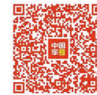
扫码观看电影《铁道游击队》精彩片段 视频剪辑:游超艺

重温经典,光影长存。硝烟弥漫中,一列火车驶出,载来了“铁道飞虎”,也载来了精彩动人的抗战史话和历久弥珍的艺术传奇。