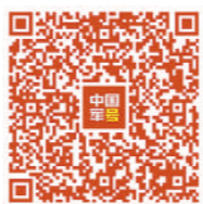
扫码观看电影《牧童投军》精彩片段 视频剪辑:薛小年

光影传情,《牧童投军》中解放军官兵为解放劳苦大众冲锋陷阵的昂扬风貌,感动着一代代观众。海报传神,这张海报已然成为无数“李小虎”坚定投身革命,甘愿为建立新中国而浴血奋战的生动写照。