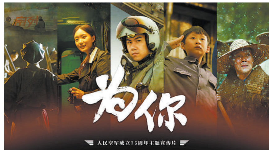
主题宣传片《为你》海报。