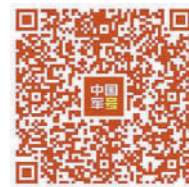
扫码观看主题宣传片《为你》

片尾处,对片中涉及的老英雄进行专访,与历史事实相呼应。从“艺术还原”到“历史溯源”,主题宣传片《为你》情感力透荧屏,触动人心。