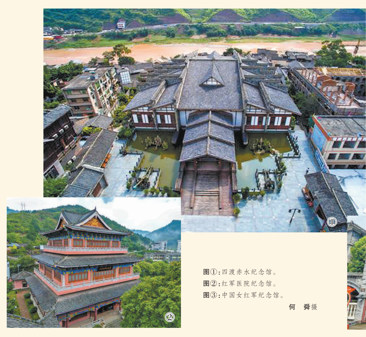
图①：四渡赤水纪念馆。 图②：红军医院纪念馆。 图③：中国女红军纪念馆。