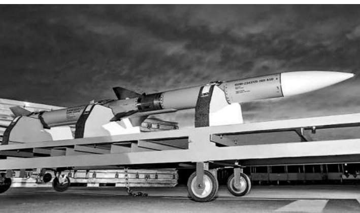
美国AIM-120先进中程空对空导弹。

新闻事实:当地时间10月29日,美国防部表示,国务院已经批准向丹麦出售先进中程空对空导弹,价值约为7.44亿美元。此前,两国达成一项为期10年的防务协议,允许美军驻扎在丹麦境内。