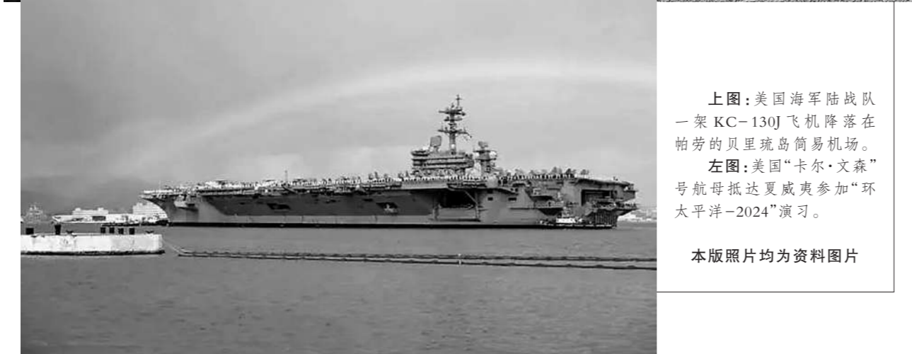
上图:美国海军陆战队一架KC-130J飞机降落在帕劳的贝里琉岛简易机场。 左图:美国“卡尔·文森”号航母抵达夏威夷参加“环太平洋-2024”演习。