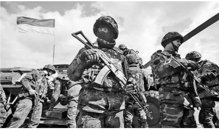
正在执行任务的乌克兰士兵。

新闻事实:当地时间10月29日,乌克兰国家安全委员会秘书利维科在乌最高拉达(议会)上表示,将再次征召16万新兵加入武装部队,这将使其部队的人员配备率提高到85%。